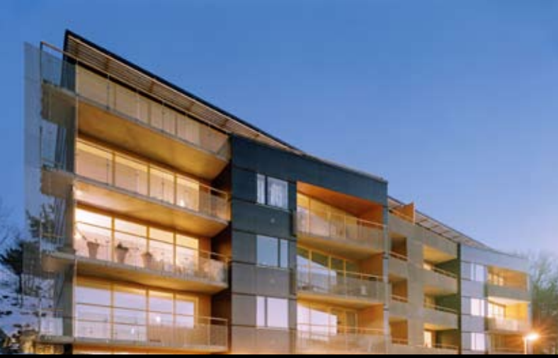
Vävskedsgatan. White arkitekter.