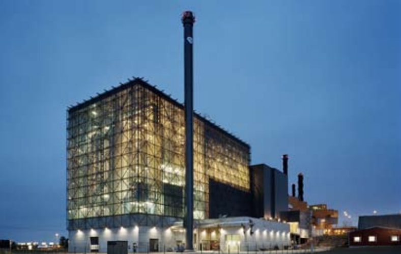
Gästaverken. Berg Arkitektkontor AB.