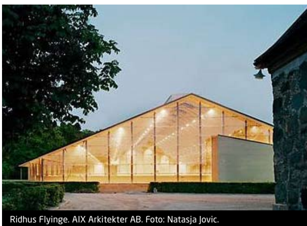
Ridhus Flyinge. AIX Arkitekter AB.

Sammantaget är därmed närmare 700 000 personer beroende av samhällsbyggnadssektorn.