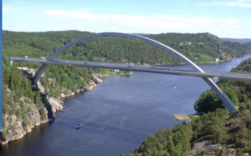
Svinesundsbron. Vägverket.

Samhällsbyggnadssektorns roll för tillväxten kan knappast över-skattas. Branschen påverkar både tillväxten i sig och tillväxtens förutsättningar genom sin roll i näringslivets och det offentliga investeringar (allt från affärer till sjukhus och skolor) genom väg- och järnvägsbyggandet, och givetvis, genom bostadsbyggandet. Men sektorns betydelse är än större! Det är genom underhåll, installationer och smärre ombyggnader som en god boendesituation skapas. Det är också i hög grad investeringar och underhåll i fastigheter och infrastruktur som avgör hur samhällets energi och miljöpåverkan förändras.