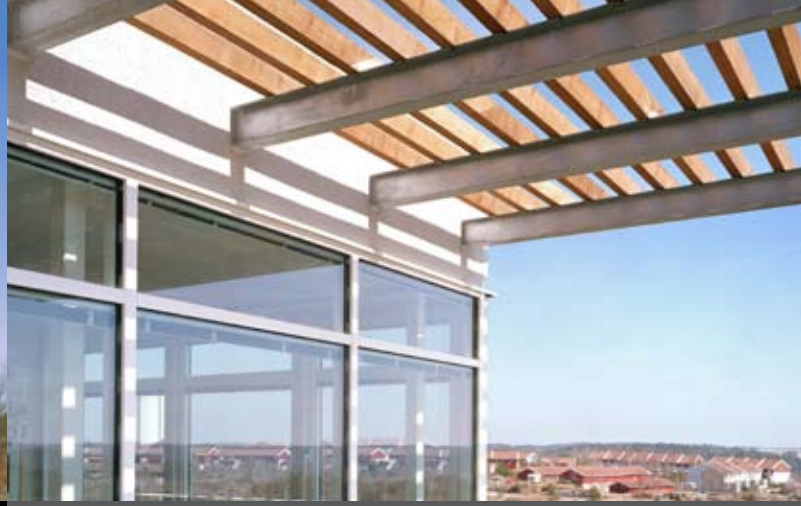
Östra Gärdsten. LILJEWALL arkitekter AB.